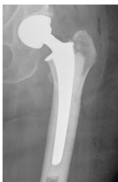
Höftkulan har ersatts med en höftprotes

Efter en höftprotesoperation är det vissa restriktioner som du måste tänka på.