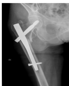
Frakturen fogas samman av en grov spik i mörghålan