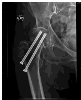
Frakturen fogas samman av två skruvar