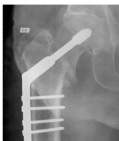
Frakturen fogas samman med metallplatta och skruvar