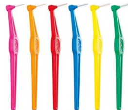
TePe Angle (6 storlekar, 0,4–0,8 mm)