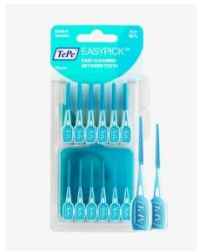
TePe Easy Pick