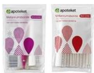
Apoteket mellanrumsborste (6 storlekar, 0,5–1,2 mm)