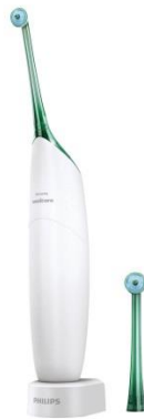
Philips Sonicare Airfloss Pro