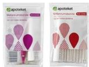
Apoteket mellanrumsborstar (6 storlekar, 0,5–1,2 mm)