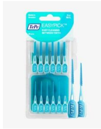
TePe Easy Pick