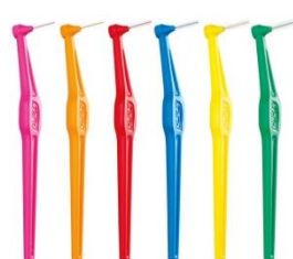
TePe Angle (6 storlekar, 0,4–0,8 mm)