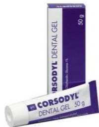
Corsodyl-gel 1 %