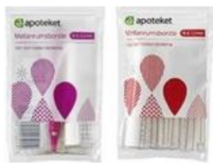
Apoteket mellanrumsborste (6 storlekar, 0,5–1,2 mm)