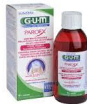
GUM Paroex 0,06%