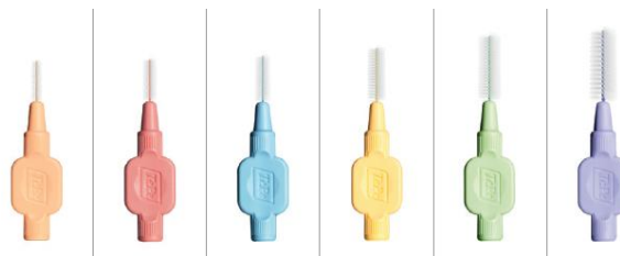
TePe, extra mjuk (6 storlekar, 0,45–1,1 mm)