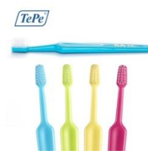
TePe Supreme, litet borsthuvud