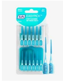
TePe Easy Pick