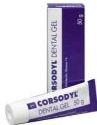
Corsodyl-gel 1 %