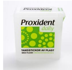
Proxident, plast (extra mjuka)