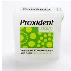
Proxident, plast (extra mjuka)