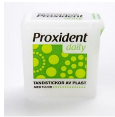
Proxident, plast (extra mjuka)