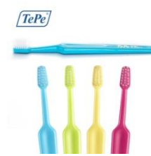
TePe Supreme, litet borsthuvud