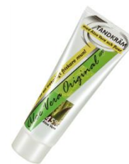
Aloe Vera Original (lågslipande)