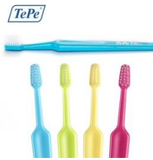
TePe Supreme, litet borsthuvud