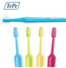
TePe Supreme, litet borsthuvud