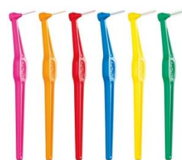
TePe Angle (6 storlekar, 0,4–0,8 mm)