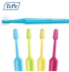
TePe Supreme, litet borsthuvud