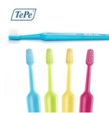
TePe Supreme, litet borsthuvud