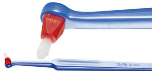
TePe, extra mjuk tip