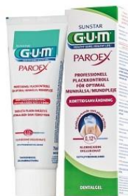
GUM Paroex 0,12%