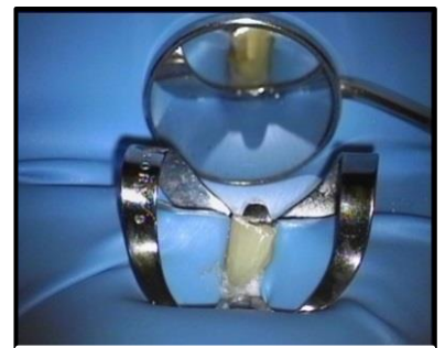
Gummiduken över tanden

Vid behandlingen sätts en gummiduk över tanden så att endast tandkronan är synlig. Detta görs för att avskärma tandens pulpa från bakterier i munnen. Den skyddar också från instrument och rengöringsmedel som används i behandlingen. Behandlingen utförs under lokalbedövning. Ofta behövs flera besök, speciellt om tandens pulpakanaler är trånga och böjda. Vanligt är 2-4 besök innan behandlingen är klar.